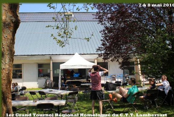
1er Grand Tournoi Régional Homologué du C.T.T. Lambersart